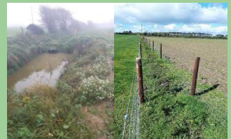
Sedimentval en hekken op Ierse boerderijen