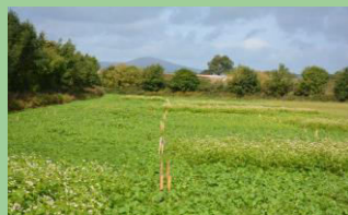
Groenbemestingsproeflocatie in Ierland