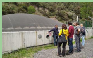
Formació dels agricultors sobre les MTD analitzades