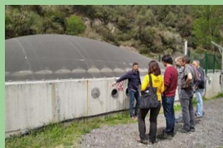
Uddannelse af landbrugere i analyserede BAT'er